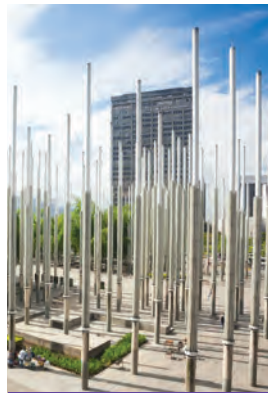
Plaza de las Luces