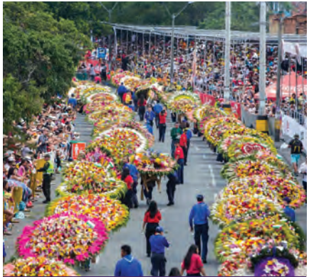
Desfile de Silletteros