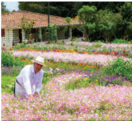
Finca Silletera, Santa Elena