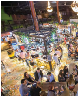
Mercados del Río